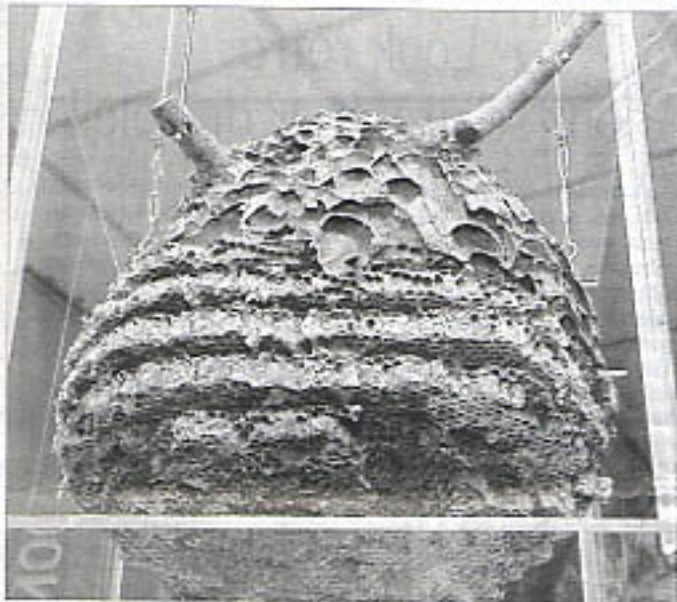
L'exposition dévoile de nombreux nids d'insectes dont les nids impressionnants du frelon asiatique.

Exposition « Les insectes bâtisseurs » au Muséum d'histoire naturelle, 3, rue du Président-Merville à Tours, visible jusqu'au 8 février 2009. Ouvert de 10 h à 12 h et de 14 h à 18 h, du mardi au vendredi ; de 14 h à 19 h, samedi, dimanche et jours fériés. Tél. 02.47.64.13.31