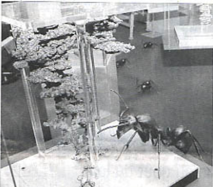
Exceptionnels, les moulages en aluminium de fourmières réalisés par l'américain Walter Tschinkel.